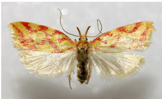
Hypercallia citrinalis (Scopoli, 1763)