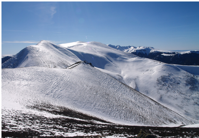
Fig.1, au dessus du col de la croix Morand en février 2019