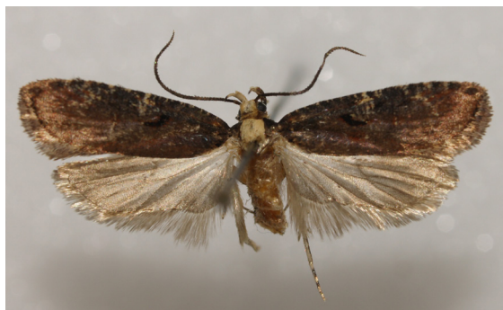
Agonopterix liturosa (Haworth, 1811)