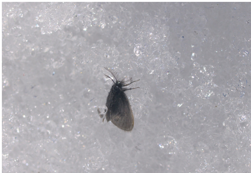
Fig. 4, Epichnopteryx plumella (Denis & Schiffermüller, 1775)