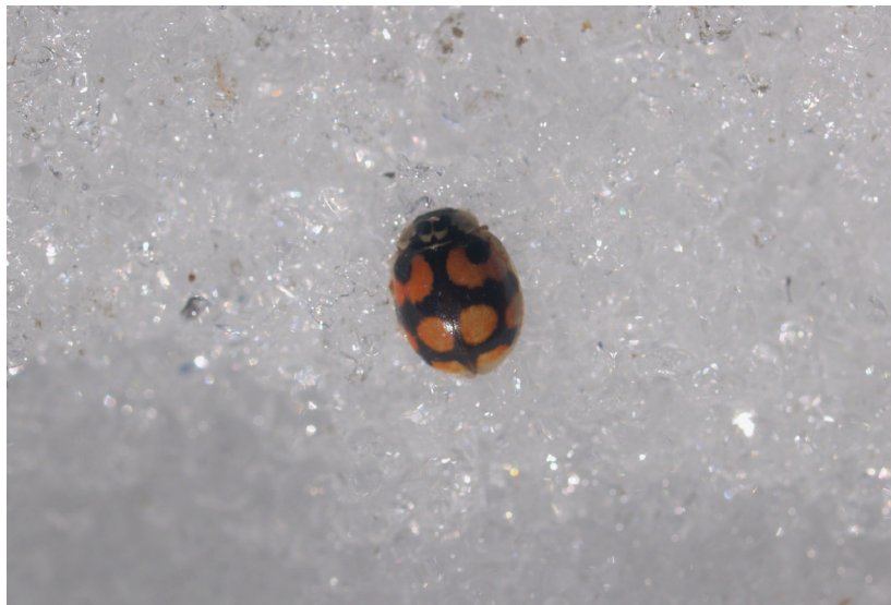
Fig. 6, Adalia decempunctata (Cliché F.Fournier)