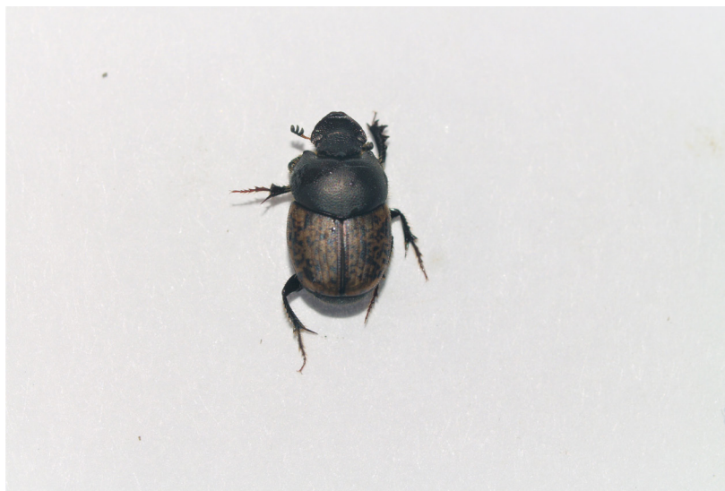
Fig. 7, Onthophagus fracticornis