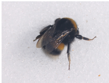
Fig. 3, Bombus sp

Calmont B. 2018 - Étude des Coléoptères coprophages (Scarabaeoidea et Hydrophilidae) de la réserve naturelle nationale de Chastreix-Sancy (63). 2019. 26 pages.