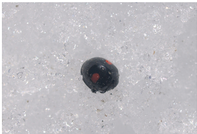
Fig. 5, Chilochorus renipustulatus (Scriba, 1791)