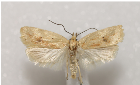
Agonopterix kaekeritziana (Linnaeus, 1767)